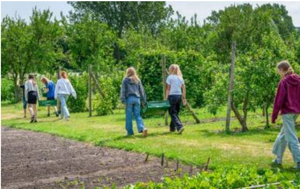
Tuinderij Vrij Waterland

Zaterdag 25 mei 2024 - 10.00 tot 16.00 uur Tuinderij Vrij Waterland & Rudolf Steinercollege