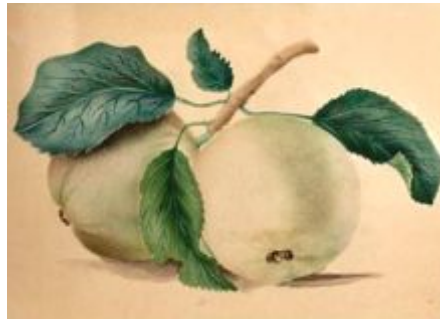
Aquarel door Kaspar Hauser

naam, aanspreekvorm en titel reproduceren bij de juiste persoon als hij deze weer zag, terwijl zulke begrippen in die periode nog geen enkele betekenis voor hem hadden. Bij vlagen scheen hij helderziend en de gedachten van mensen al te kennen voordat deze waren uitgesproken. Kaspars onbevangen en standvastige waarheidszin bracht niet alleen menige bezoeker, maar ook Daumer zelf wel eens in verlegenheid. Kaspar leerde al snel mooi te schrijven en oefende zich met succes in het tekenen en schilderen.