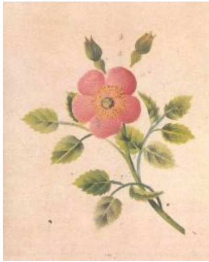
Aquarel door Kaspar Hauser