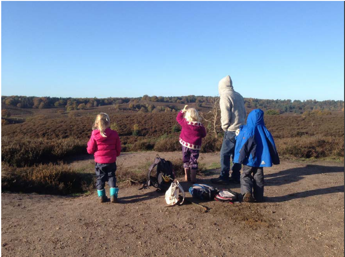
Kleuters maken een wandeling van 5,5 km op de Posbank.

school, dat je zo flexibel kan bewegen met elkaar. Een kleuter die dan naar Tosca toeloopt en zegt 'ik vind jou lief'. En dat je dan ziet dat deze boodschap nu net even nodig was."