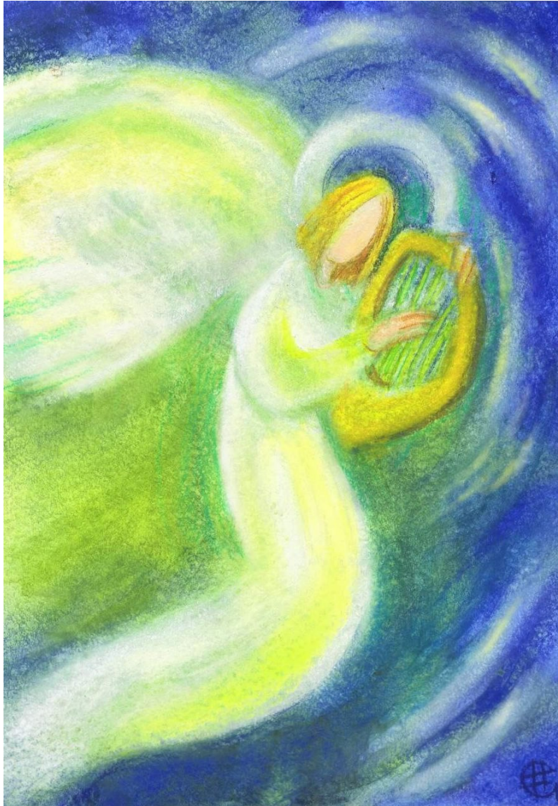
Schildering van Natasha Yeschenko