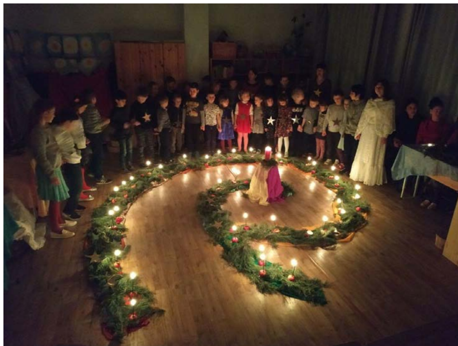
Advent 2021 in de vrijeschool van Yaroslava in Kharkiv

"Hallo! Mijn kinderen en ik keerden onlangs terug naar huis in Kharkiv. Het is namelijk heel duur om een flat te huren in Ivano-Frankivsk. In Kharkiv is het rustiger nu. Natuurlijk viel wel de stroom uit. En zonder stroom doet de verwarming het niet. Maar we laten ons niet ontmoedigen. Het is fijn om weer thuis te zijn. Ik bezocht mijn klas en maakte daar een video van voor mijn leerlingen. De tijd stond er stil vanaf februari.