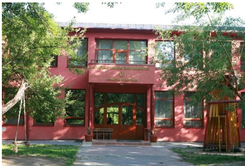
Vrijeschool in Bratislava – Slowakije